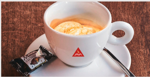
ESPRESSO AFFOGATO 5,50 € Eine Portion Espresso mit einer Kugel Schweizer Vanilleeis in der Tasse