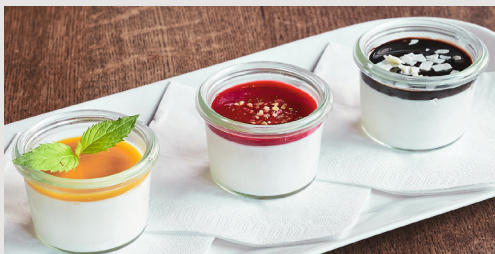
PANNA COTTA TRILOGIE 8,90 € Hausgemachte Verführung mit roter Beeren-, Maracuja- und Schokoladensauce