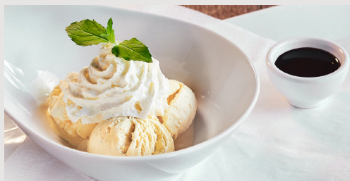
COUPE DENMARK 8,90 € Drei Kugeln Schweizer Vanilleeis mit Schokosauce und Obers