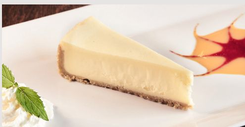
ORIGINAL NY CHEESECAKE 2 7,90 € Direkt für Sie aus New York eingeflogen: mit Frischkäse und Sahne, so dass er sogar der Freiheitsstatue ein Lächeln ins Gesicht zaubert