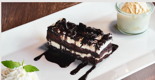
OREO® BROWNIE 8,90 € Warmer Brownie mit OREO® Schokokeks, Schweizer Vanilleeis und Obers