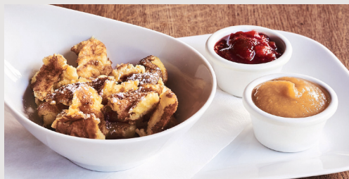
KAISERSCHMARRN VON DER ALM Schön fluffig mit Zwetschgenröster und Apfelmus 9,90 €