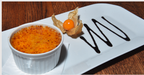
CRÈME BRÛLÉE 8,90 € Die besondere Verführung - ein Klassiker. Samtige Crème mit Bourbon Vanille & knackig karamellisiertem braunen Vollrohrzucker