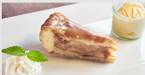
APPLE PIE AUS PENNSYLVANIA 8,90 € Köstlich warmer Apfelkuchen, Zimt und Karamell auf einem Mürbeteigboden mit Schweizer Vanilleeis und Obers