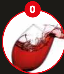
O SCHWEFELDIOXID UND SULFITE