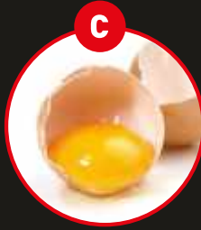
C EIER VON GEFLÜGEL UND DARAUS GEWONNENE ERZEUGNISSE