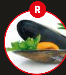
R WEICHTIERE WIE SCHNECKEN, MUSCHELN, TINTENFISCHE UND DARAUS GEWONNENE ERZEUGNISSE