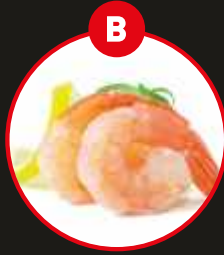
B KREBSTIERE UND DARAUS GEWONNENE ERZEUGNISSE