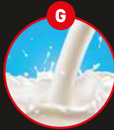
G MILCH VON SÄUGETIEREN UND MILCHERZEUGNISSE (INKLUSIVE LAKTOSE)