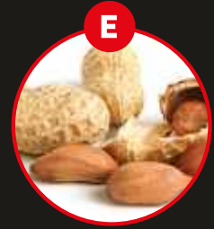
E ERDNÜSSE UND DARAUS GEWONNENE ERZEUGNISSE