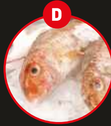
D FISCH UND DARAUS GEWONNENE ERZEUGNISSE (AUSSER FISCHGELATINE)