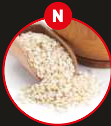
N SESAMSAMEN UND DARAUS GEWONNENE ERZEUGNISSE